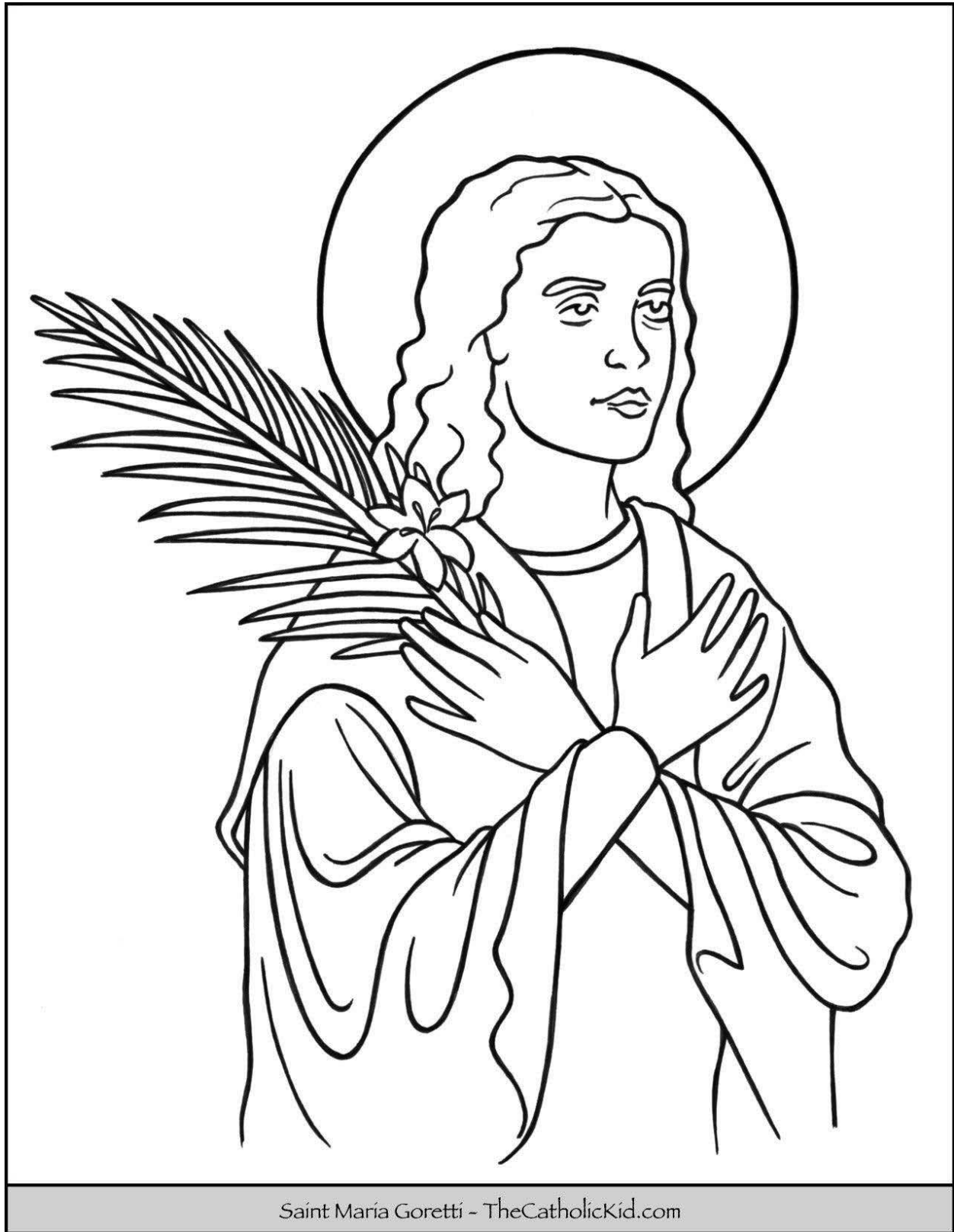
Saint Maria Goretti - TheCatholicKid.com