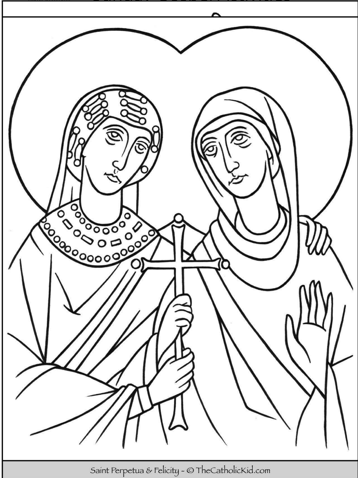
Saint Perpetua & Felicity